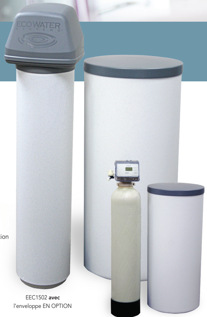
EEC1502 avec l'enveloppe EN OPTION